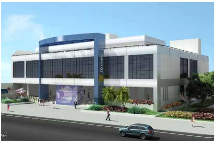
Nova sede Barra 2012